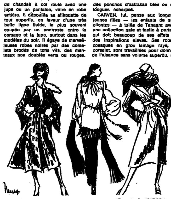
CARVEN : La petite robe noire revient, travaillée en souplesse dans une soie décapotée de schwarzwald... GIVENCHY : Ensemble du soir à cascade de jersey de soie blanche de Goutille, portée avec une écharpe noire du même jersey...

Moderato cantabile, ainsi pourrait-on résumer l'esprit des tendances d'hiver chez les couturiers. En effet, la profusion entre l'hiver dernier et le prochain se caractérise par un changement de volumes et de proportions. Tout est plus modéré, de la coiffure lisse aux pieds chaussés de bottes ou d'es-carpines. Les grandes capes font place aux ponchos ou aux imperméables — ceinturés ou non — parfois ourlés de fourrure. Les ensembles à superpositions sont très importants, et la combinaison du chef pompiste lancée par Saint-Laurent l'année dernière a fait des adeptes.